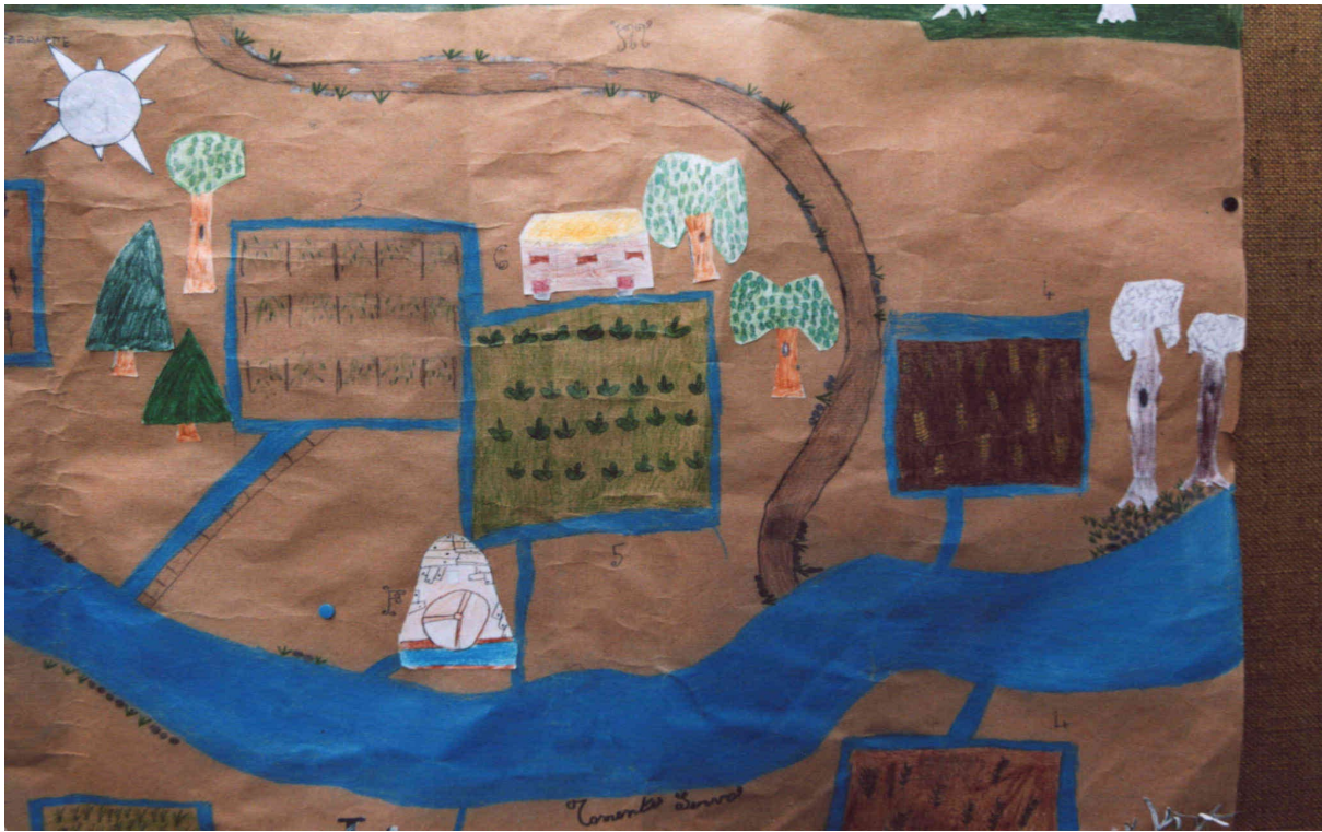
Parti della mappa