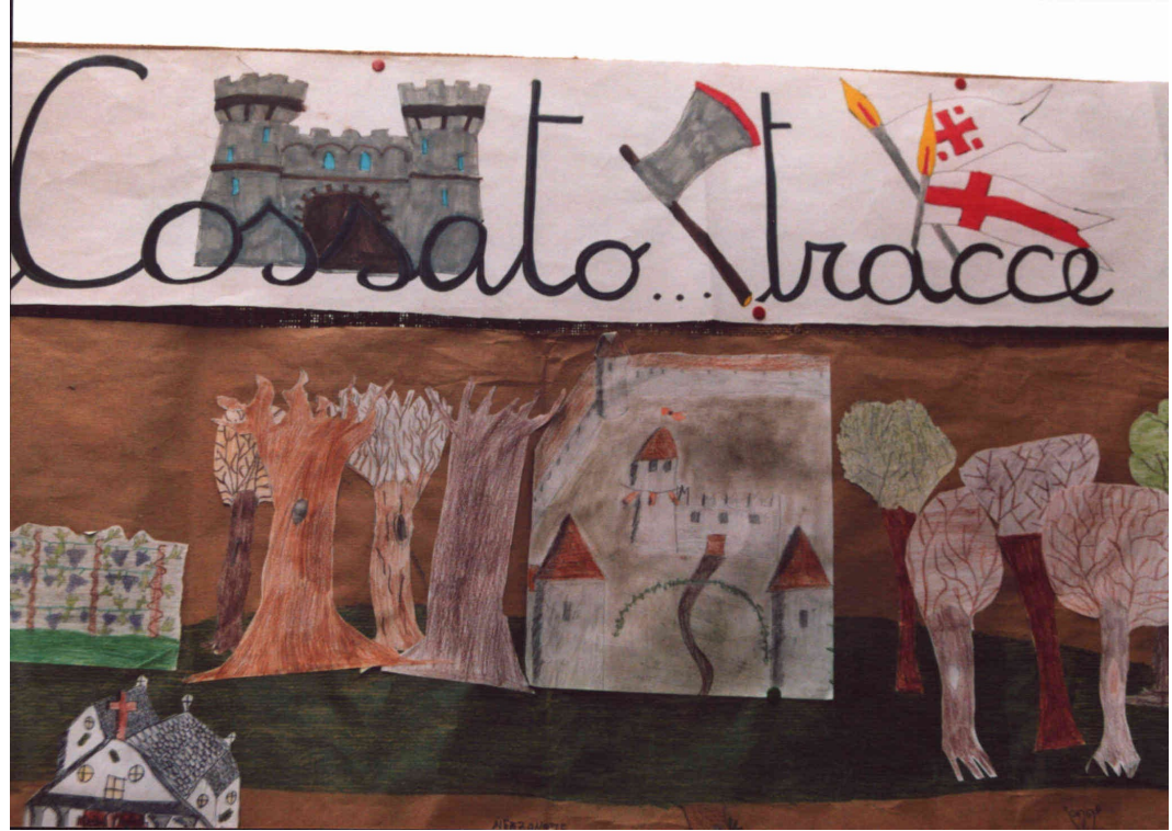
Parti della mappa