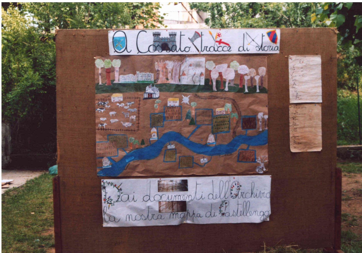
La mappa di Castellengo